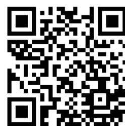
文物徵集表格 QR code